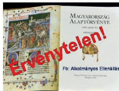
Magyarország Alaptörvénye Érvénytelen!

Tudod, hogy miért nem érted, hogy mi zajlik a világban, mi történik a hazádban? Azért, mert hazudnak neked, mert félrevezetnek. Nem csak a politikusok, de szinte a teljes tudományos, gazdasági és jogi „elit”, valamint az ő hazugságukat közvetítő teljes hazai média. Még az interneten és a Facebookon is csak a szennyet öntik rád, hogy ne lásd a sok fölösleges információtól a valóságot. Ebben a káoszban igyekezzünk fix pontokat adni, hogy utána saját magad is el tudd dönteni, mi a helyzet, mi a valóság, ki mond igazat és ki beszél mellé, valamint ki akar félrevezetni.